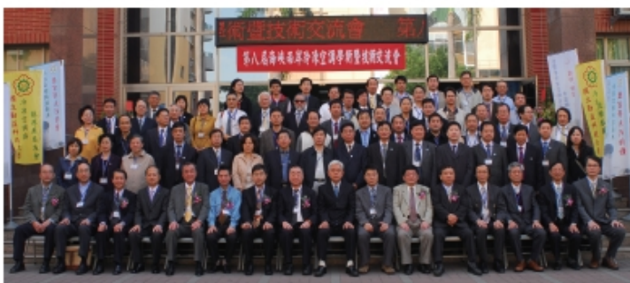
第八屆海峽兩岸冷凍空調學術暨技術交流會之學術界及業界專家合影