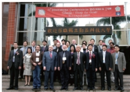
12th International Conference on ISO 9000 & TQM 國際研討會合影

完成多項行政制度之建立，如推動產學合作案辦法、「張明王國秀講座」實施辦法、推動國際暨兩岸科技文化合作交流計畫辦法、辦公室緊急事件通報系統建置，以及完成靜態網頁設計且開放上線等。